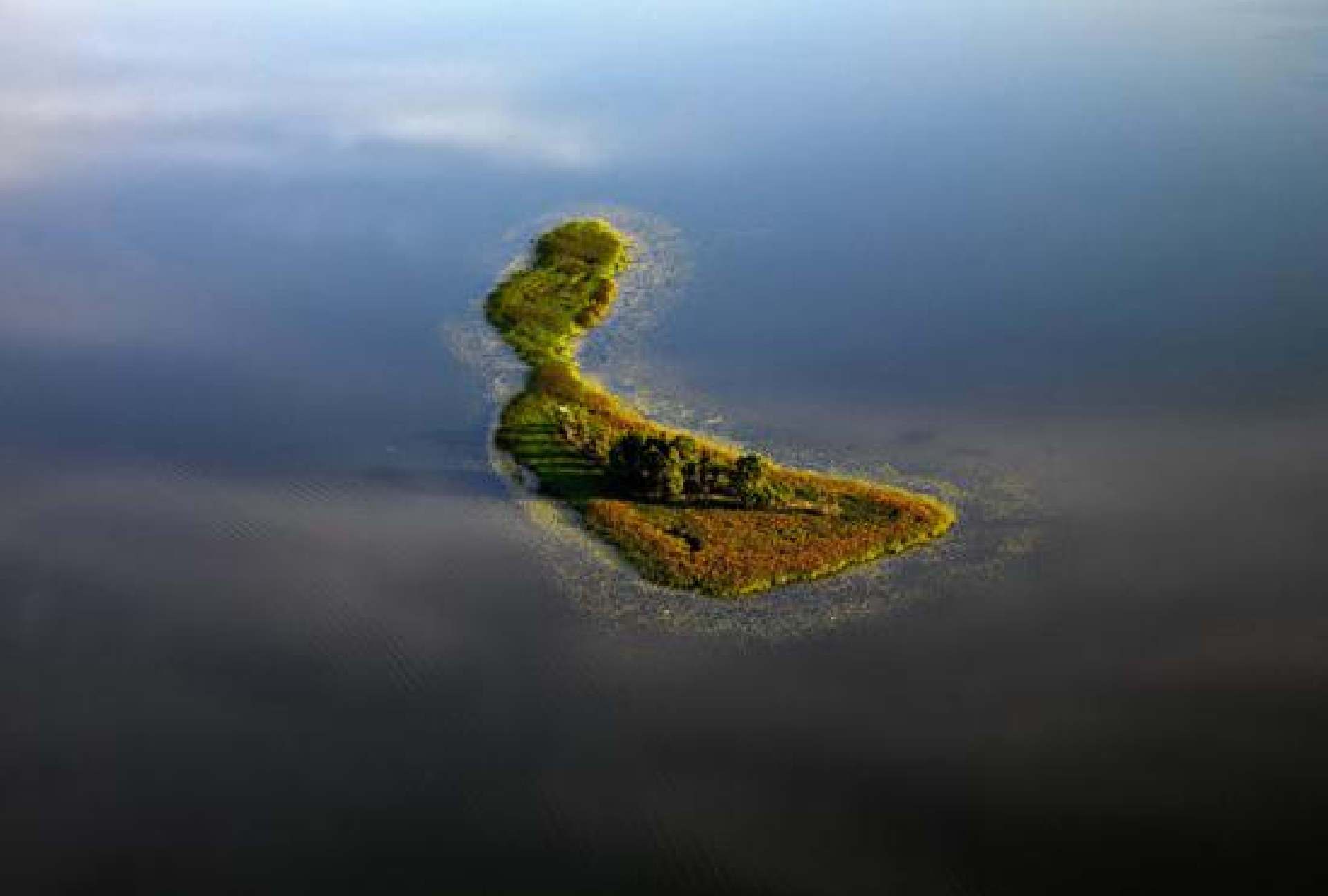
Salele Sartu ežere.