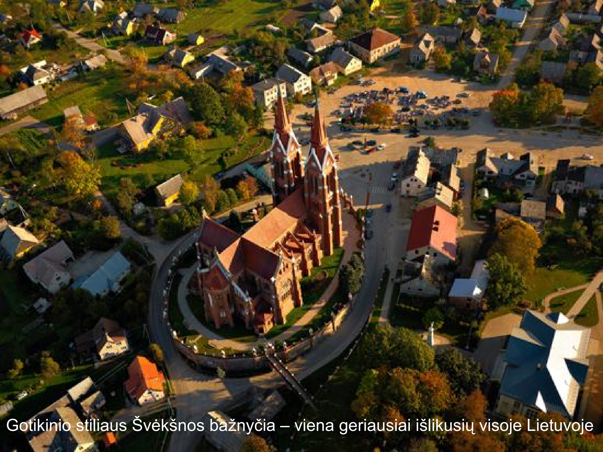
Gotikinio stiliaus Švėkšnos bažnyčia – viena geriausiai išlikusių visoje Lietuvoje