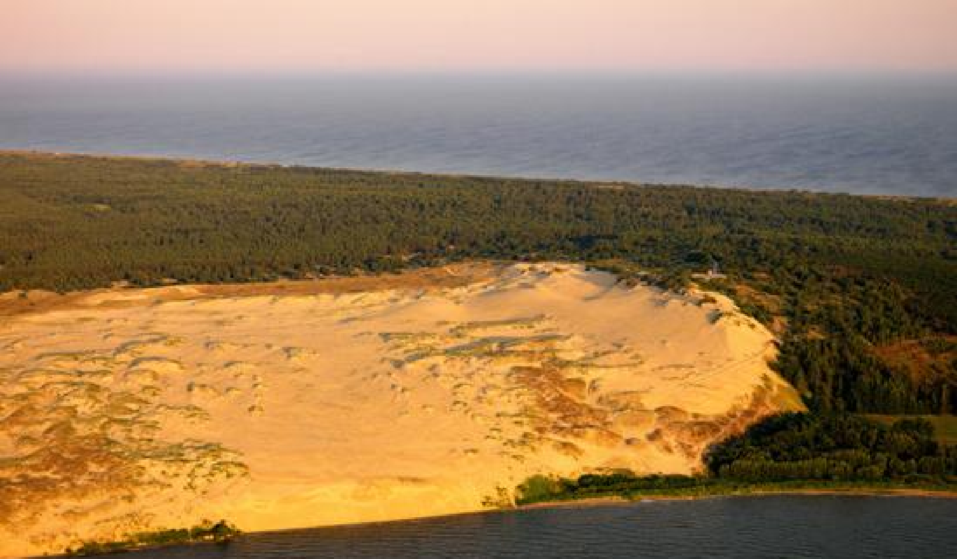
Parnidžio kopa prie Nidos. Kopos viršuje įrengta apžvalgos aikštelė, kurioje neapsilankius, vizitas į Neringą būtų neužbaigtas