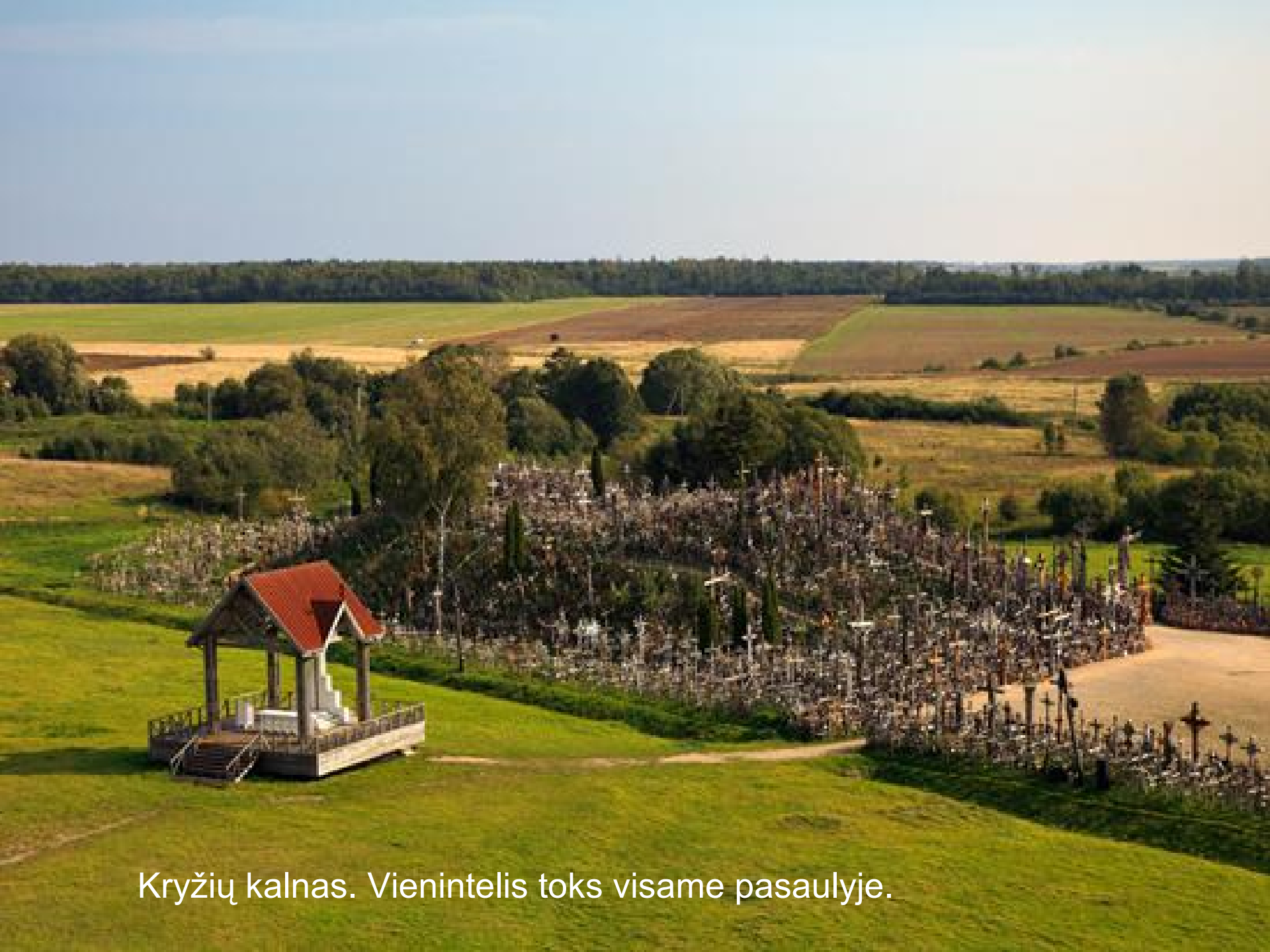
Kryžių kalnas. Vienintelis toks visame pasaulyje.