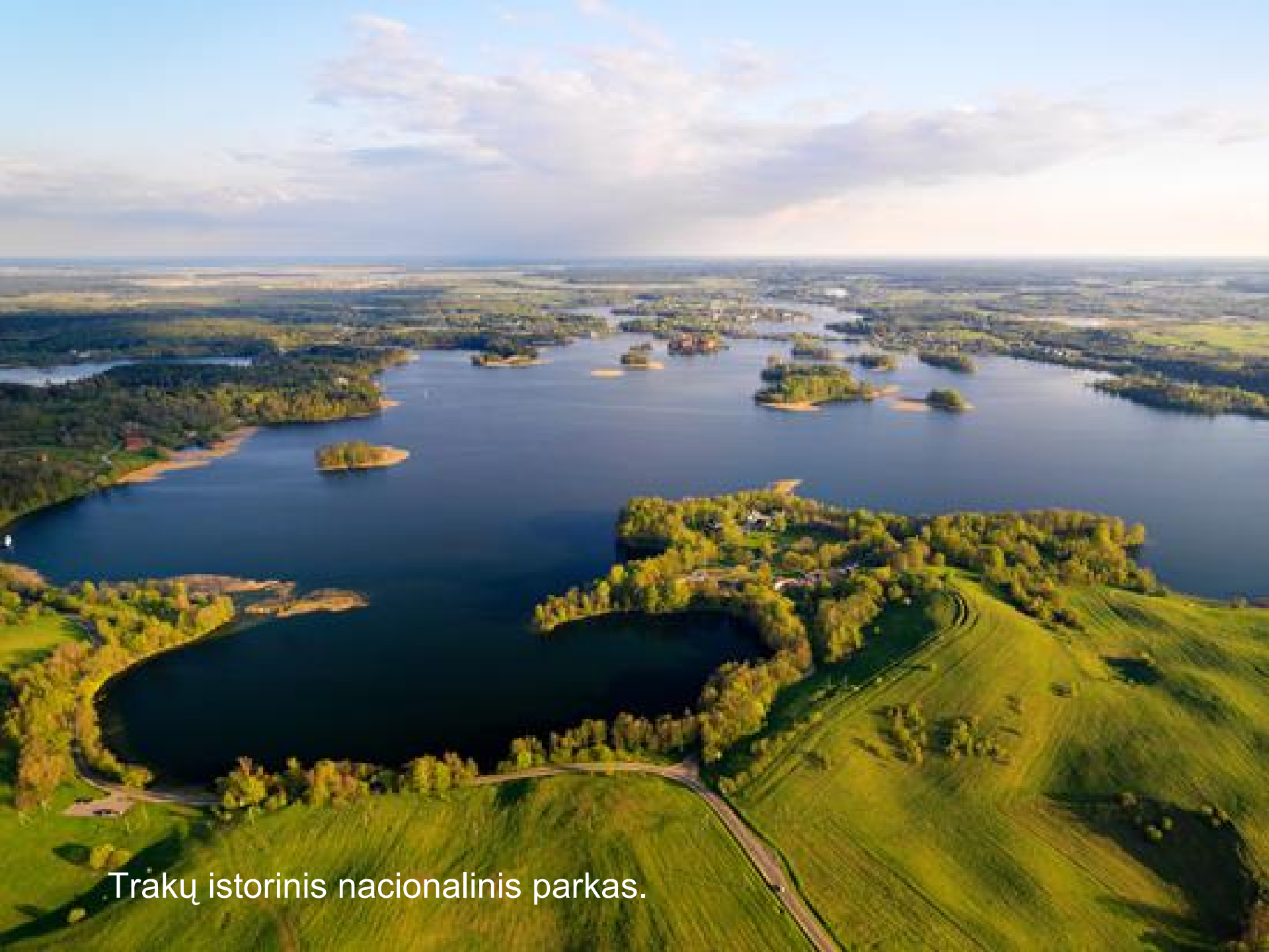
Trakų istorinis nacionalinis parkas.