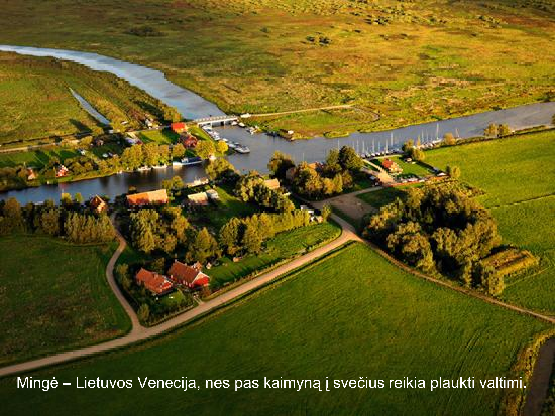
Mingė – Lietuvos Venecija, nes pas kaimyną į svečius reikia plaukti valtimi.