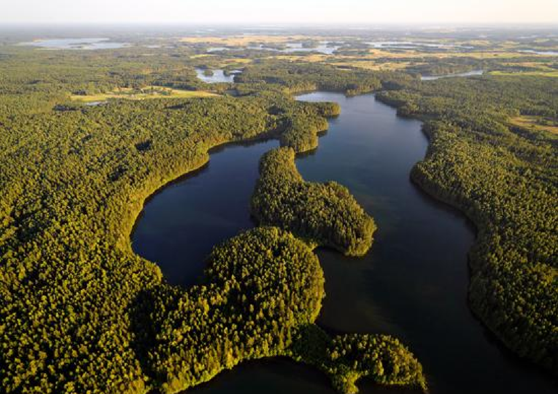
Ledyniniai ežerai „broliai dvyniai“ Baltis ir Baltelis. Labanoro giria.