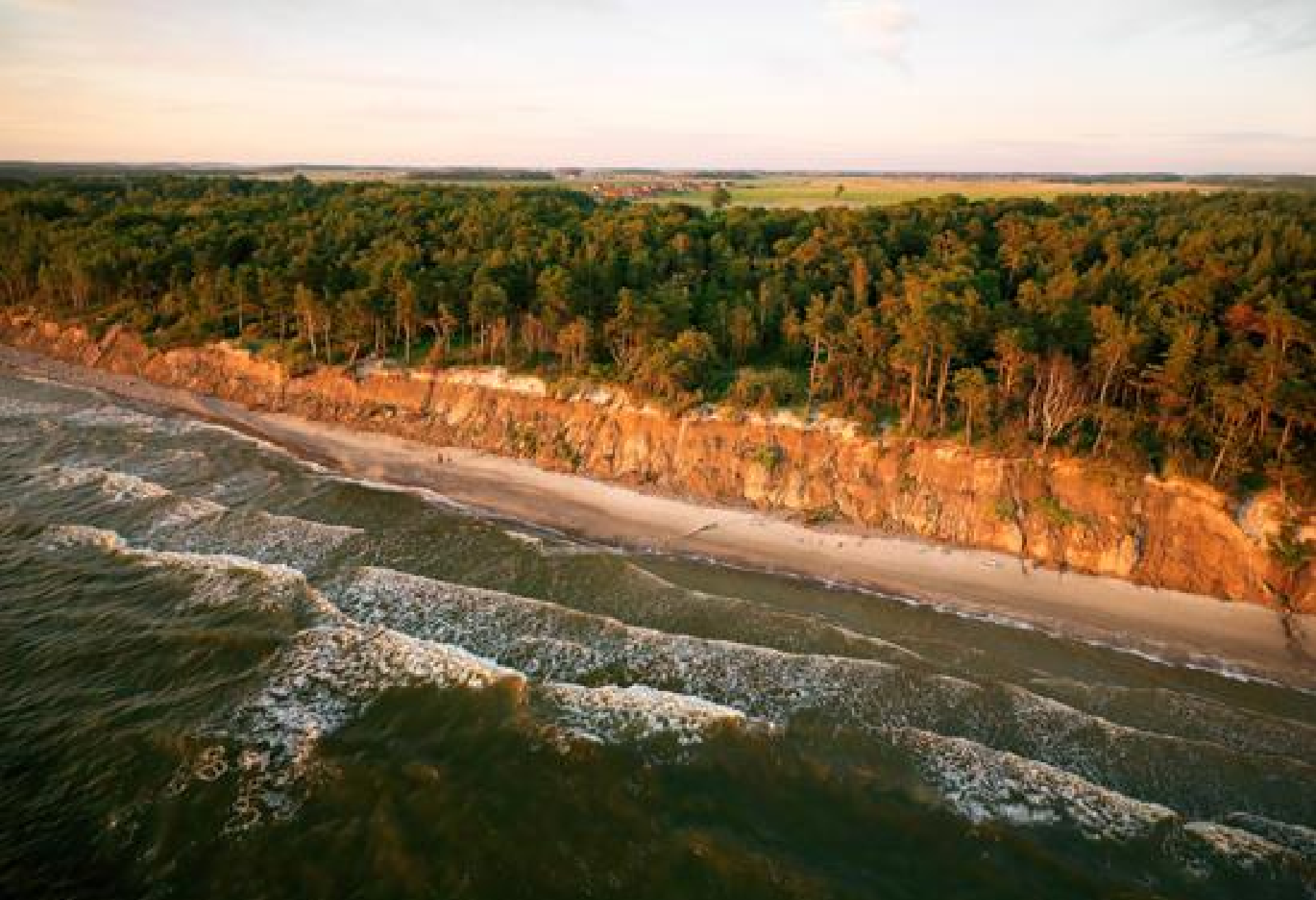
Baltijos jūros pakrantė netoli Karklės. Ledyno paliktą gūbrį nuolat ardo bangos.