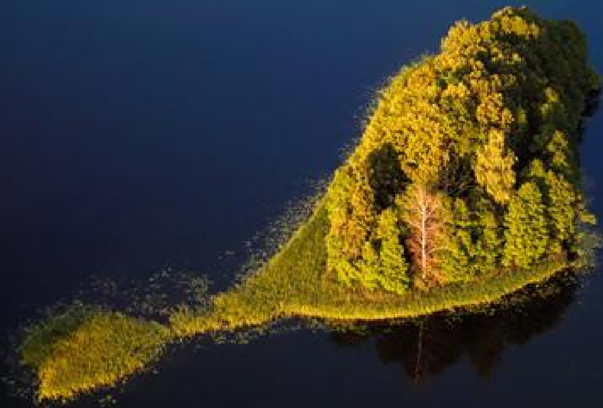
Nudžiūvusio berželio sala Aukštaitijoje.