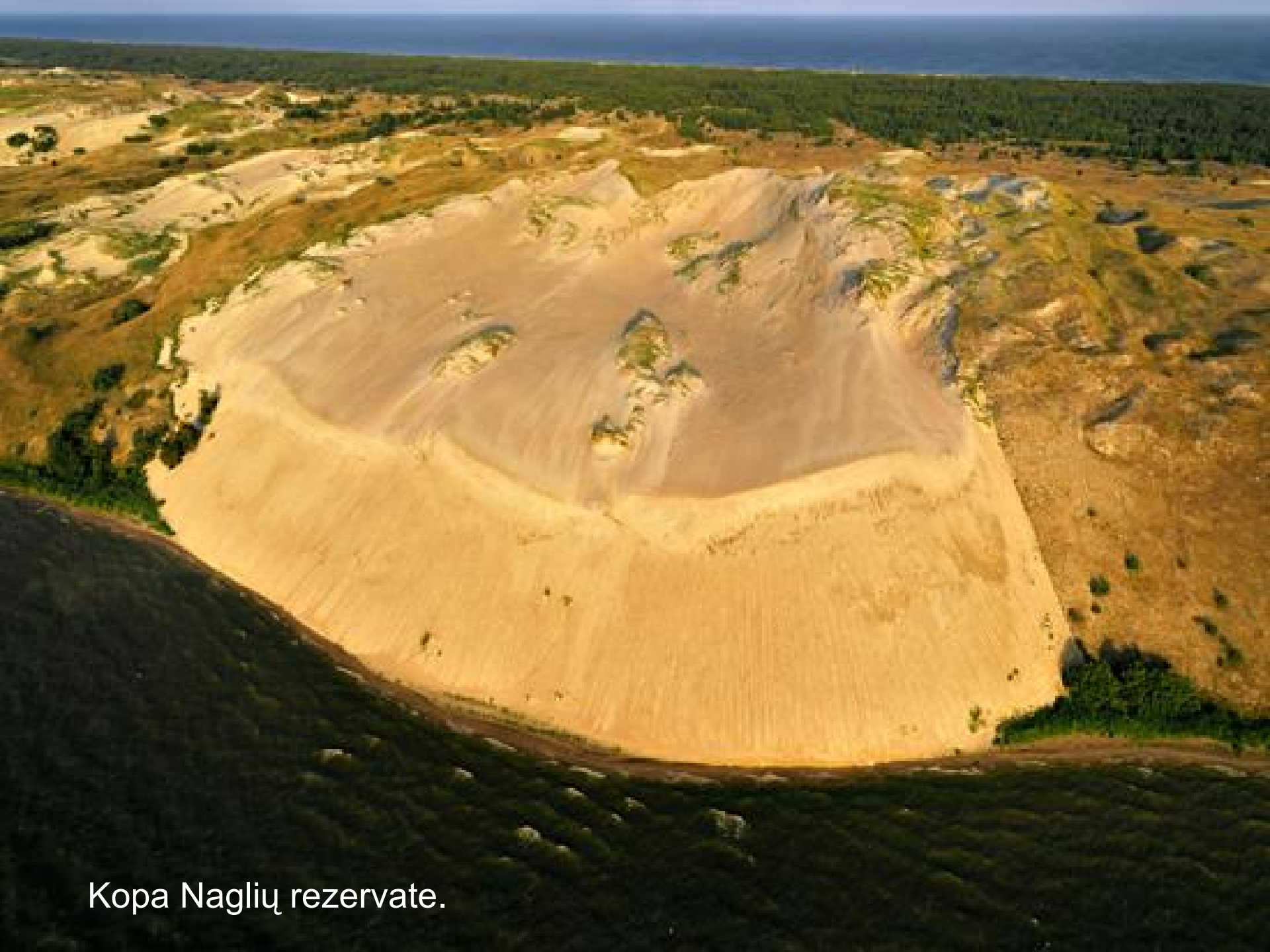
Kopa Naglių rezervate.