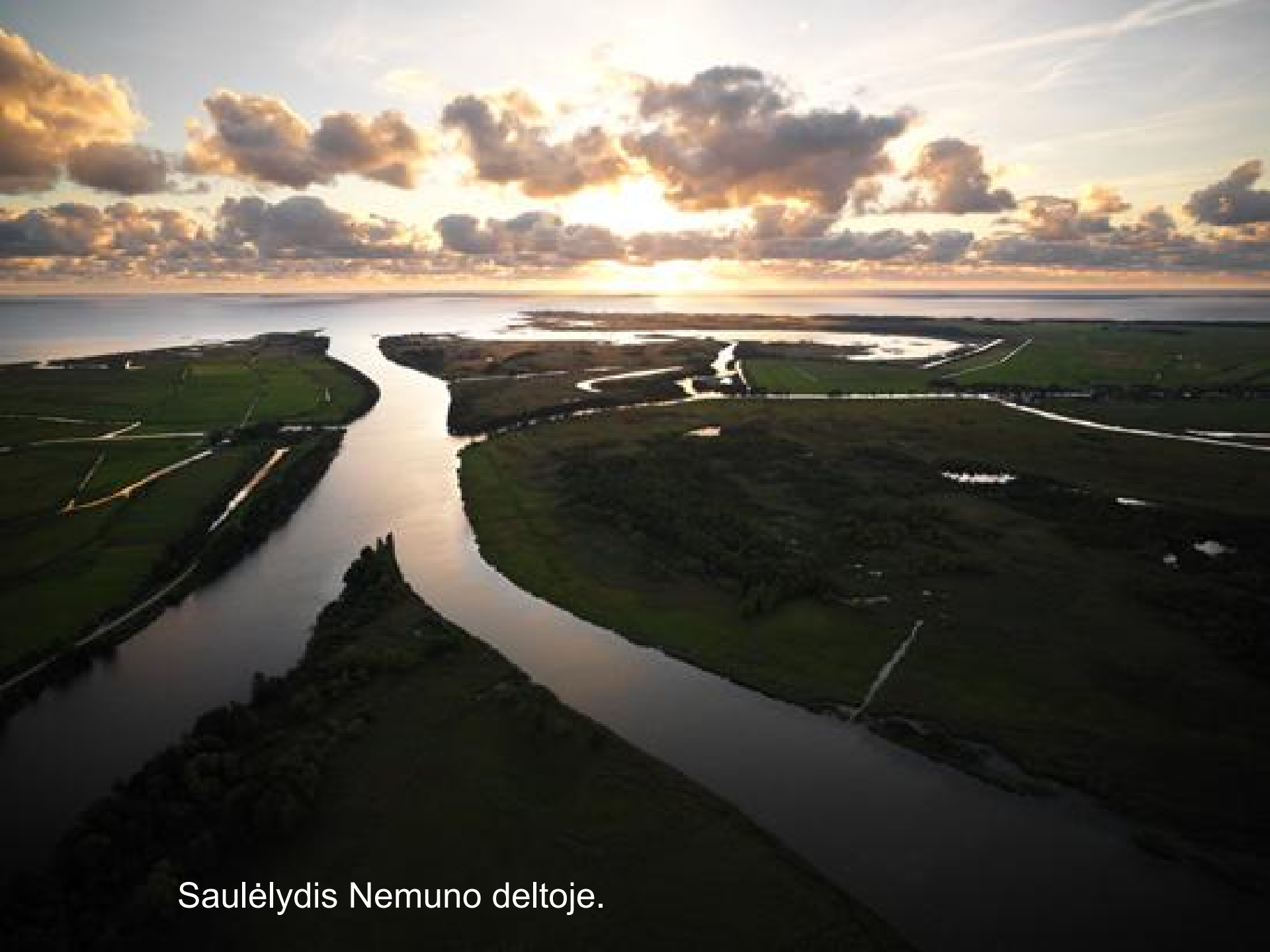
Saulėlydis Nemuno deltoje.